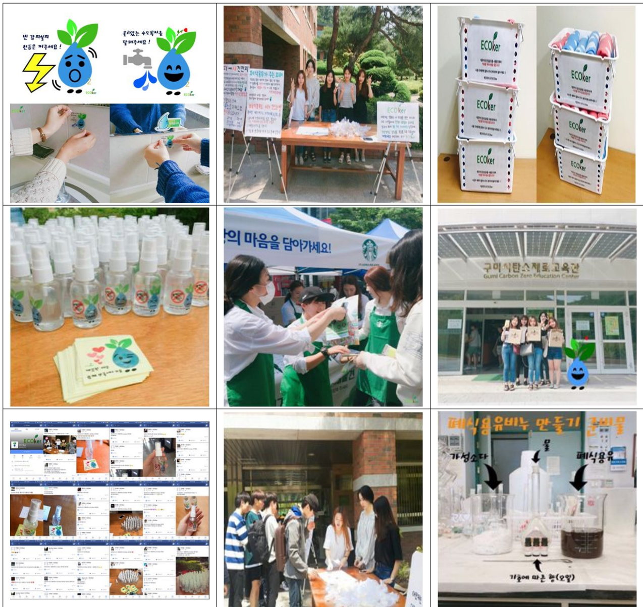
주요 활동 사진